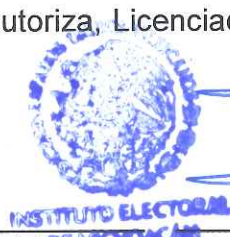
LIC. JUAN JOSÉ MORENO CISNEROS SECRETARIO EJECUTIVO DEL INSTITUTO ELECTORAL DE MICHOACÁN